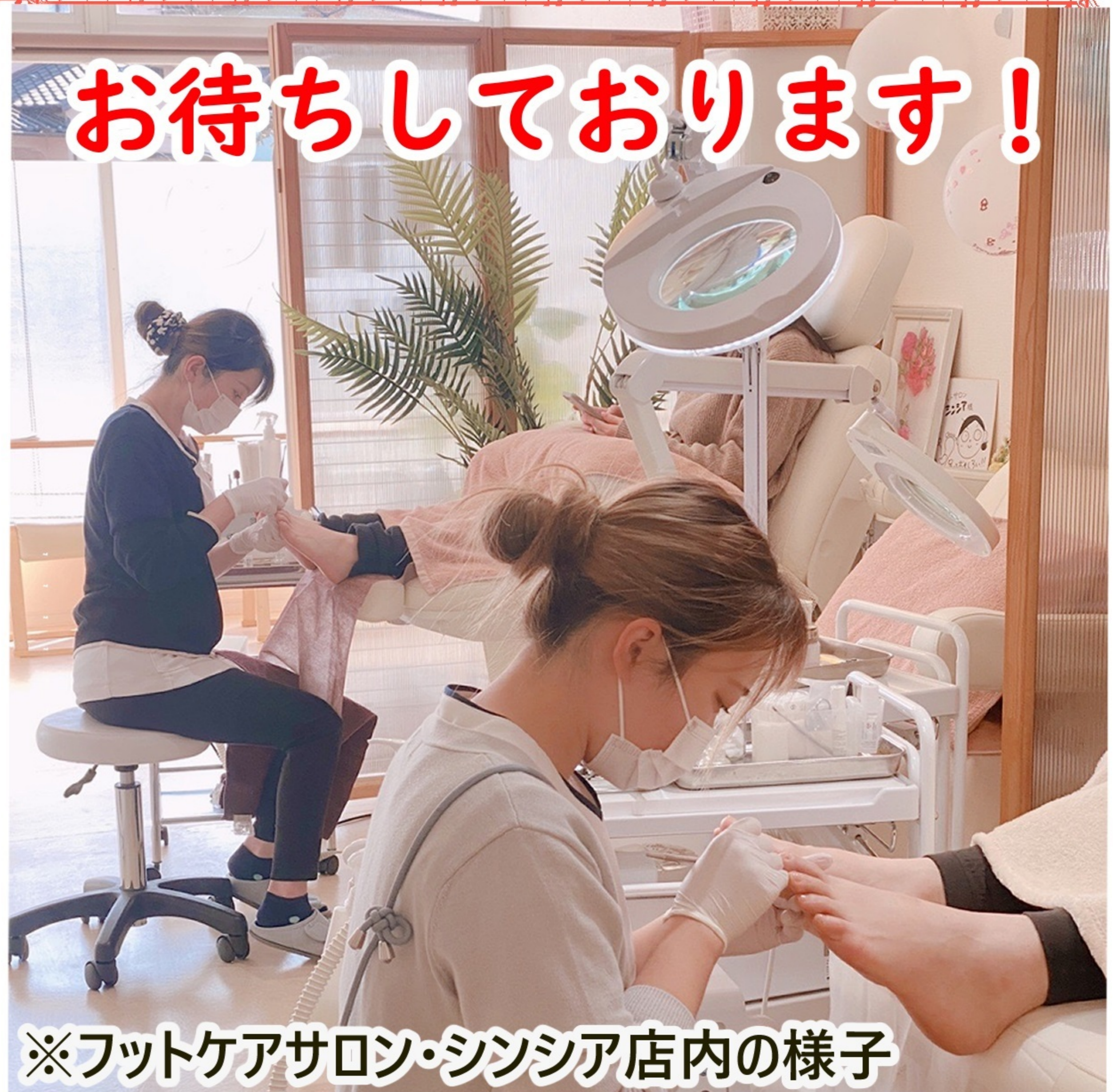
※フットケアサロン・シンシア店内の様子